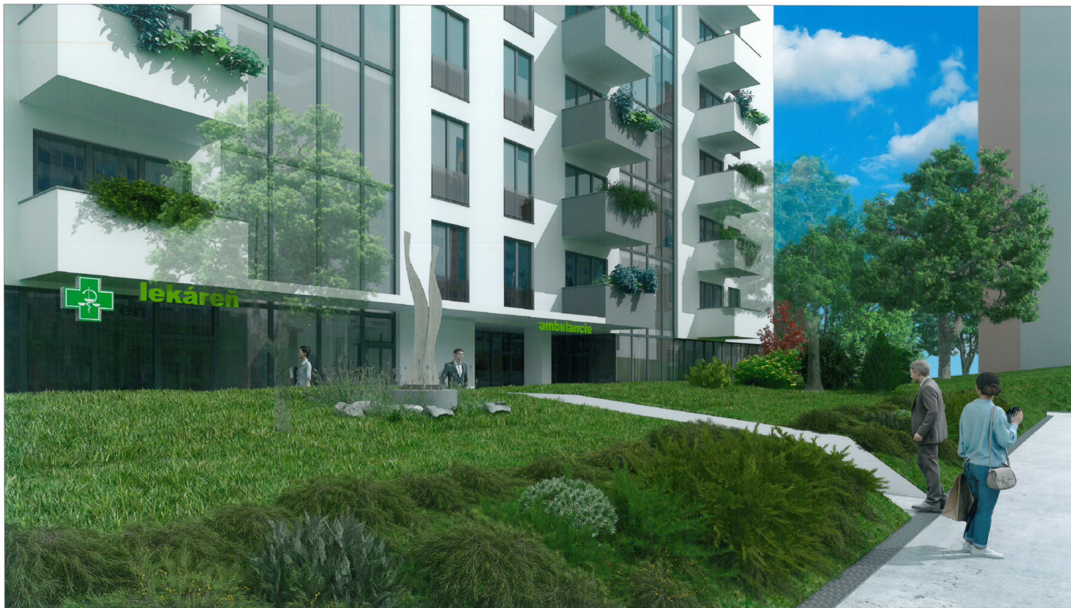
VIZUALIZÁCIA BYTOVÉHO DOMU S POLYFUNKCIOU : KOŠICE, KALINČIAKOVA ULICA ., POHĽAD SEVEROZÁPADNÝ, DETAIL VSTUPOV DO PARTERU