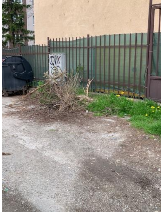
16. Zborovská – Kukučínova – Mlynárska - kríkový záhon, zabezpečiť orezy a vyčistenie odpadu Z: SMsZ v Košiciach T: 04.2023